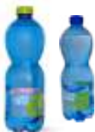
TAVINA DÀ NUOVA VITA ALLE VECCHIE BOTTIGLIE

- Punti di riciclo dell'acqua in collaborazione con Fonte Tavina, con l'utilizzo di bottiglie RPET riciclate e riciclabili.