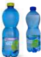
TAVINA DA NUOVA VITA ALLE VECCHIE BOTTIGLIE

- Punti di riciclo dell'acqua in collaborazione con Fonte Tavina, con l'utilizzo di bottiglie RPET riciclate e riciclabili.