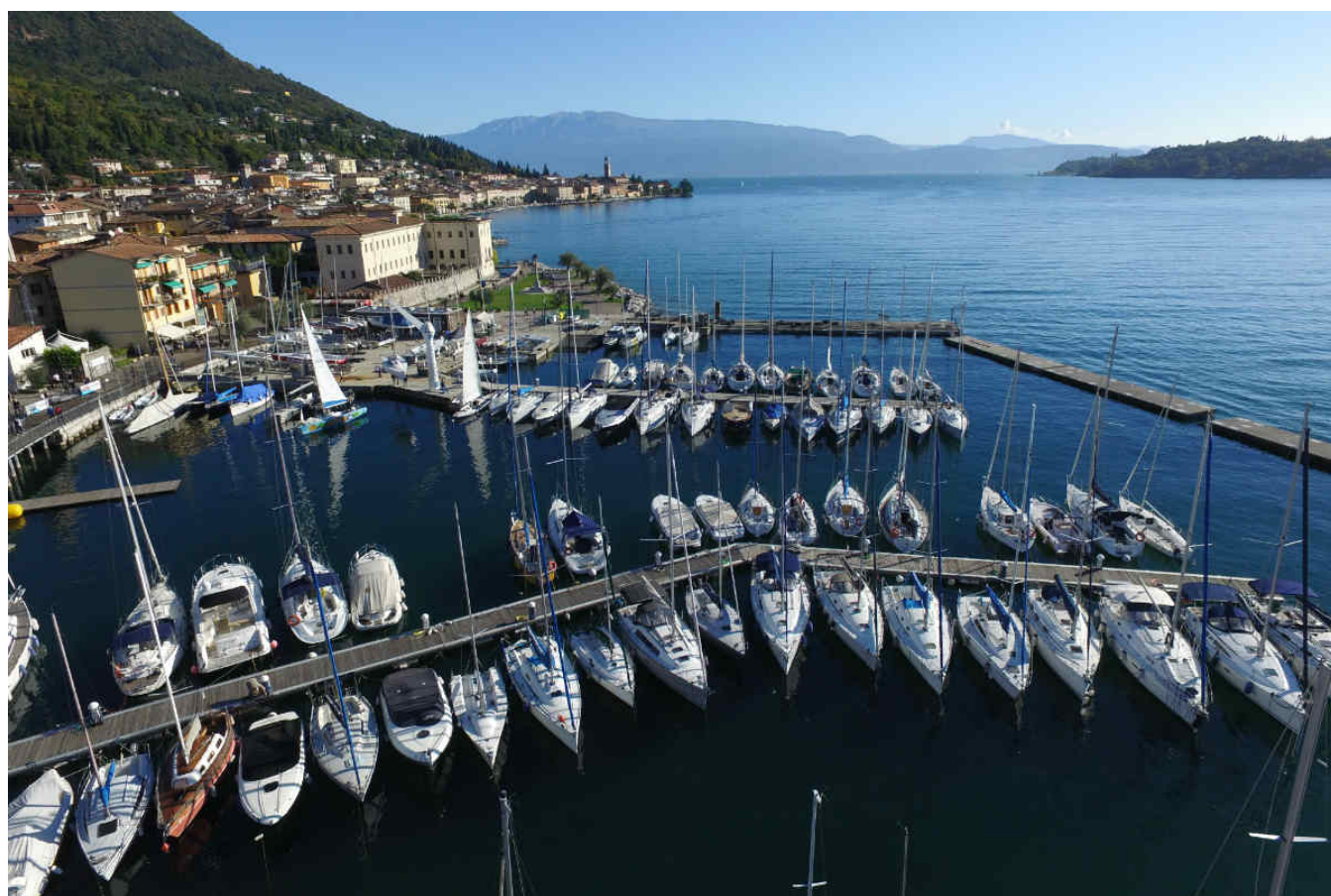
Il porto "Mauro Melzani" su cui si affaccia la sede della Canottieri Garda.