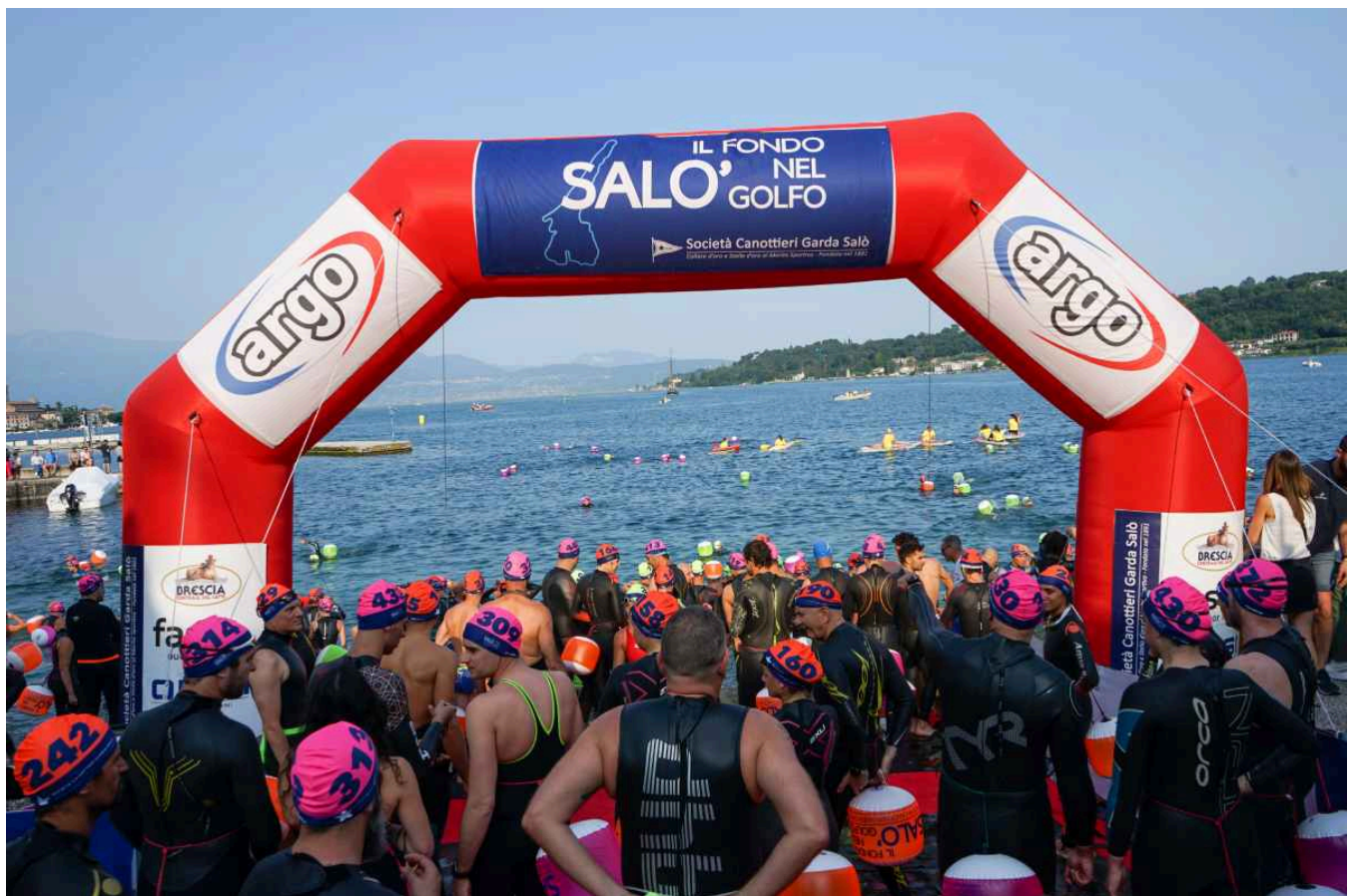
Fondo nel Golfo 2023.

Iscrizioni e regolamento: https://bit.ly/FondoNelGolfo24