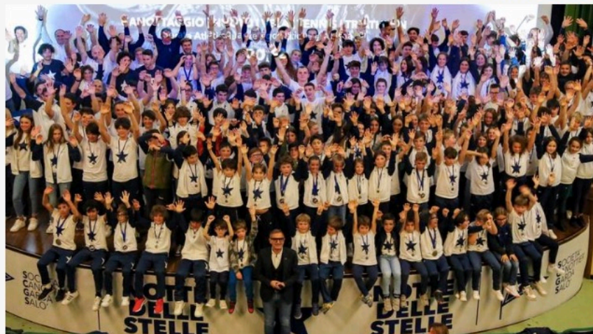
Foto di gruppo nella riuscitissima serata delle «stelle» promossa dalla Canottieri di Salò (SCARPETTAL)