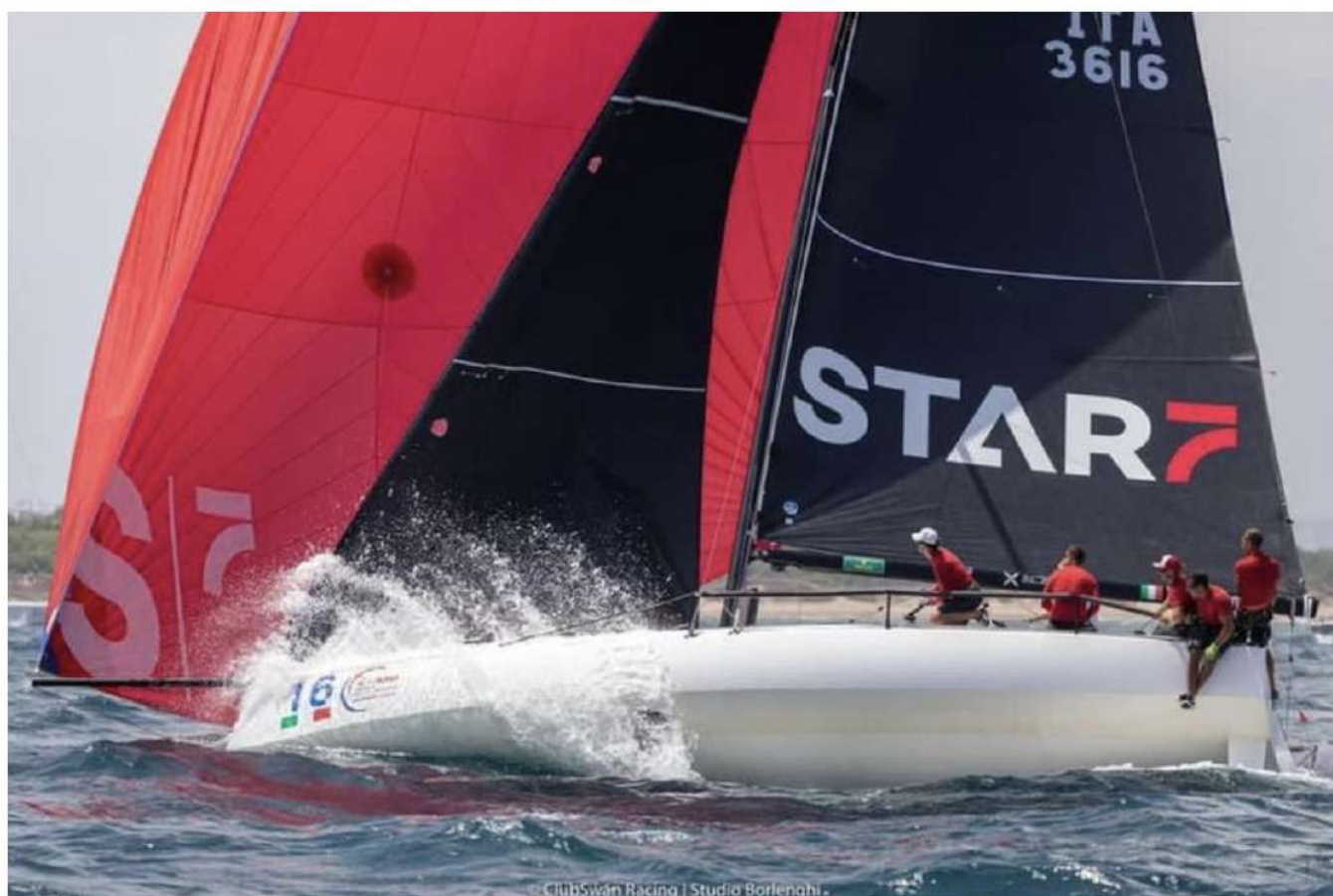
L'imbarcazione gardesana FarStar