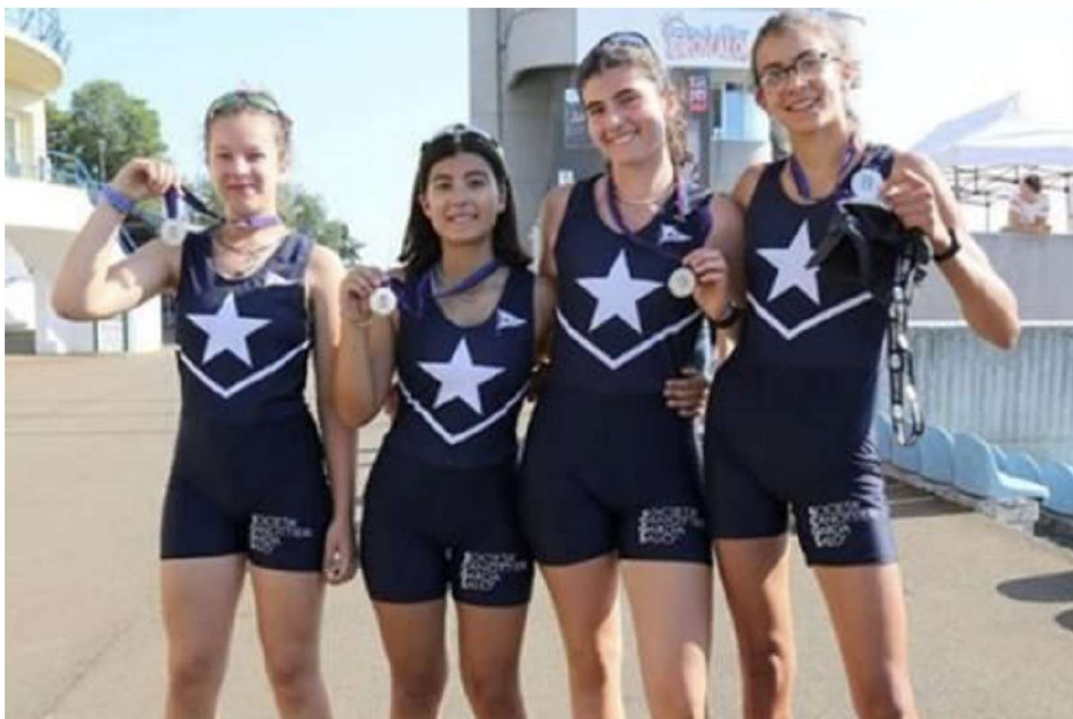
Le ragazze della Canottieri Garda