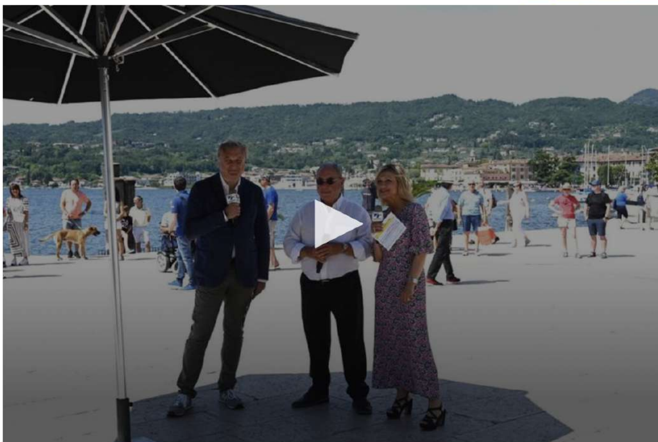
IN PIAZZA CON NOI A SALO'

Il mistero di certi posti è la loro parola, il loro linguaggio muto. Ci passi dentro, a fianco, sopra e ascolti il senso della storia e della cronaca, la certezza di una vita e di una vitalità. Salò parla di una sorte fortunata e curata della sua esistenza, il golfo è magnifico, l'acqua è fedelmente salodiana, cioè bella, e, se può, quieta; appartiene alla comunità e si dona,