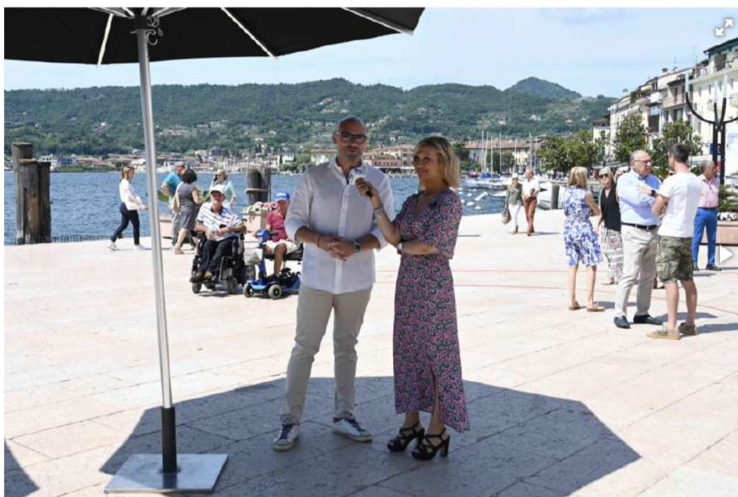
In Piazza con Noi a Salò domenica 12 giugno 2022