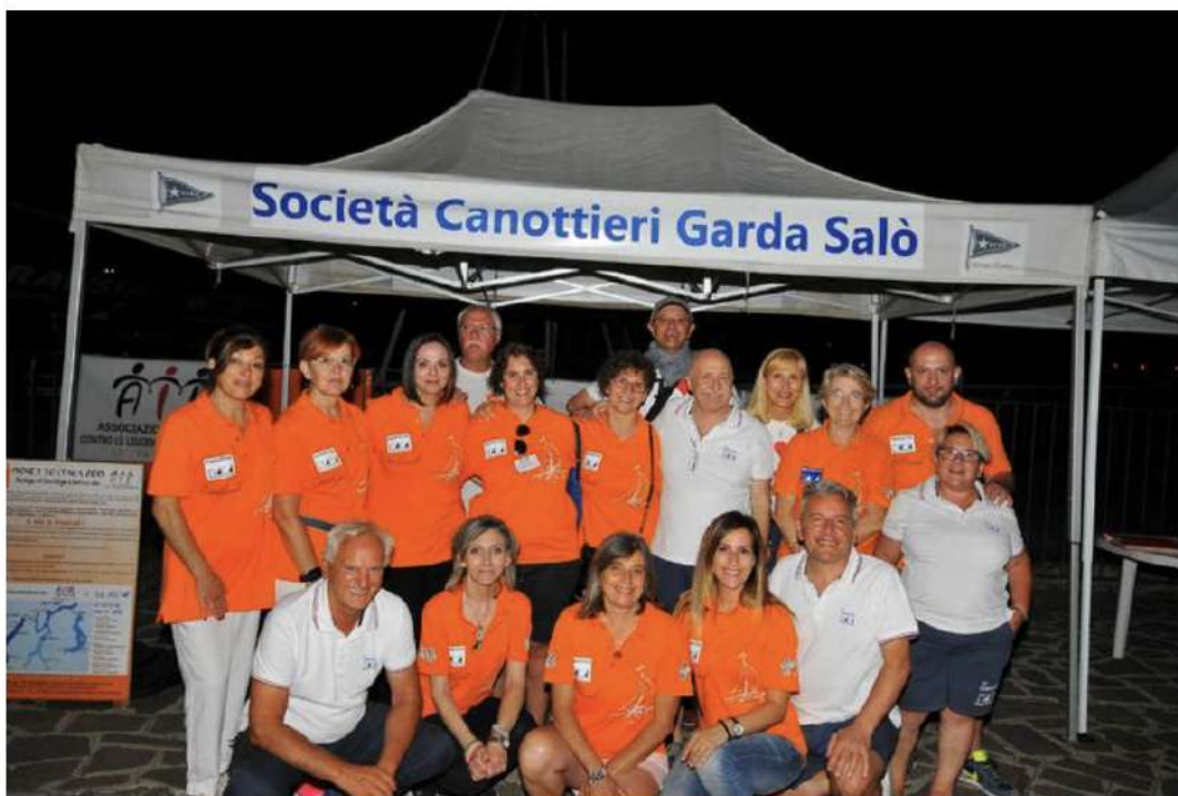
Il gruppo dei volontari della Canottieri Garda di Salò